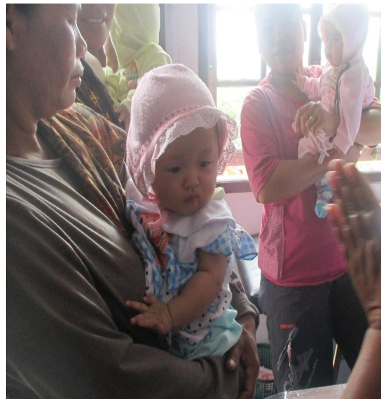
Dokumentasi Ukur Tinggi Badan